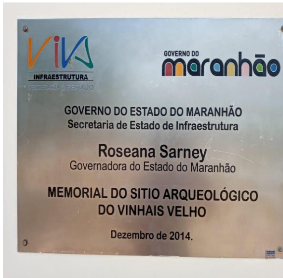
Figura 01: placa de inauguração do Memorial.