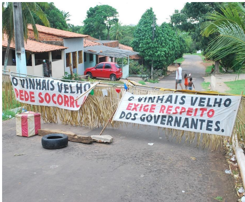
Figura 14: Barricada erguida pelos moradores como um ato de protesto antes da implantação da Via.

Além do protesto realizado, a Comunidade tomou outras medidas, como o erguimento de uma barricada com faixas para impedir as máquinas de passarem no local traçado pelo projeto (figura 14).