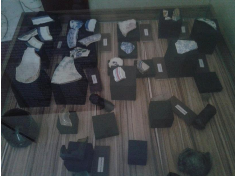
Figura 08: achados arqueológicos. Fonte: Acervo pessoal 2016.

Na figura acima tem-se a presença de fragmentos de cerâmicas de objetos feitos pelos Tupinambás e, a partir disto, há um questionamento a se realizar: qual foi a participação da Comunidade dos dias de hoje na colocação desse espaço arqueológico? Pois, ao contrário dos Centros de Ciências e Saberes, os quais relacionam-se à museus vivos, tendo em vista o resguardar de peças, mapas, trabalhos feitos pela própria “comunidade” de forma contínua e cotidiana, o memorial do Sítio Arqueológico do Vinhais Velho, possui uma relação com o Estado, tomando como base o fato de que foi o mesmo quem o “construiu” e “resguardou” de forma oficial as peças arqueológicas encontradas no processo de terraplanagem para inserção do megaprojeto de infraestrutura Via Expressa. Desta forma, a respeito de museus vivo, é válido pontuar: