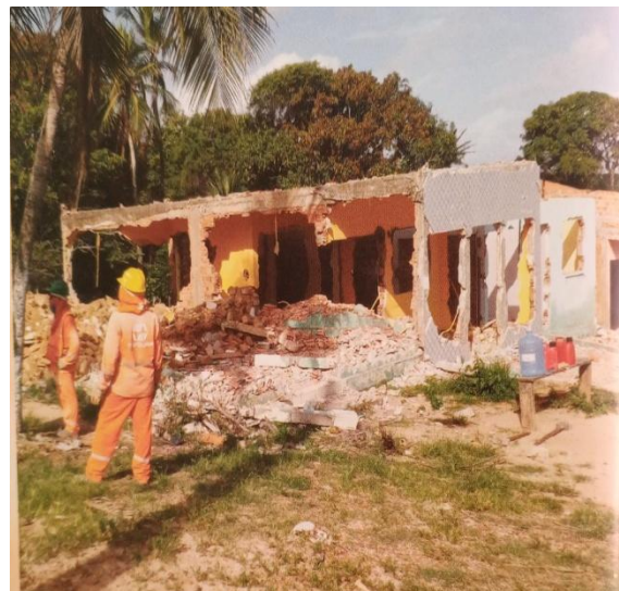
Figura 10: Demolição de casas 2. Fonte: Livro Vinhais Velho, Arqueologia, História e Memória. Autor: Arkley Marques Bandeira. Ano: 2013.

A demolição de casas foi um dos fatores que deixou a Comunidade extremamente insatisfeita e isto foi para além de outras discussões, como o encontro com as peças