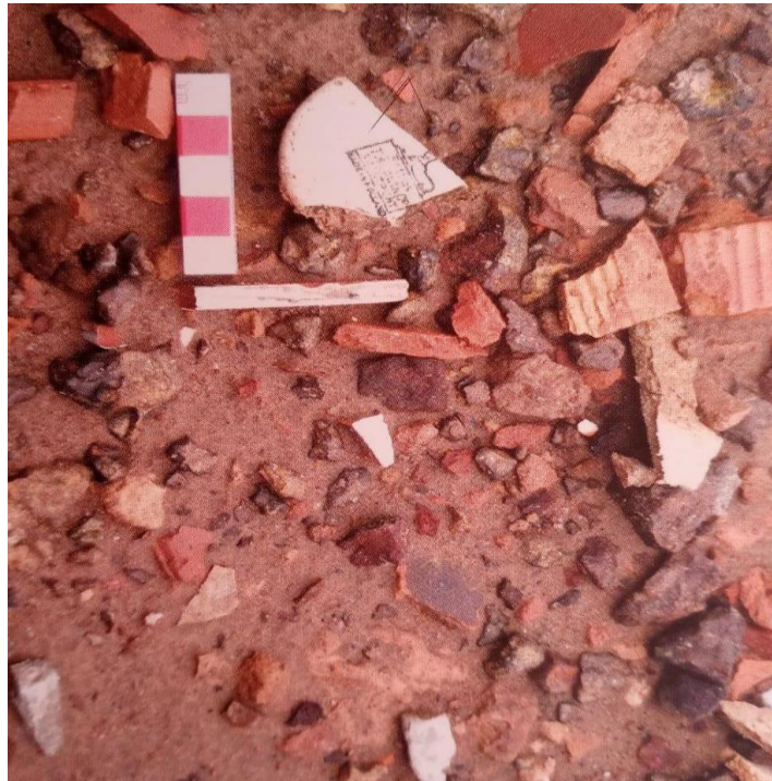
Figura 11: Artefatos indígenas encontrados soterrados no quintal de casa no Vinhais Velho.

Abaixo, na figura 11, tem-se o registro de artefatos indígenas encontrados nos terrenos em que as casas demolidas estavam.