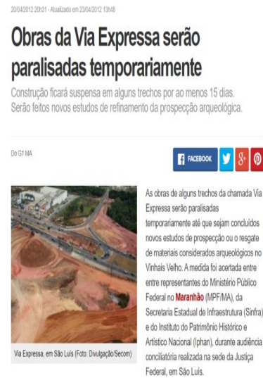
Figura 04: Obras da Via Expressa são paralisadas temporariamente.

As imagens expostas acima retratam de forma sintética recortes de jornais e blogs que abordaram o caso da Comunidade Vinhais Velho no período de implantação do