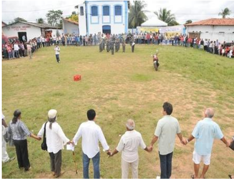
Figura 13. Manifestação dos moradores em frente à igreja São João Batista.