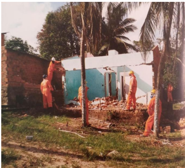
Figura 09: Demolição de casas. Fonte: Livro Vinhais Velho, Arqueologia, História e Memória. Autor: Arkley Marques Bandeira. Ano: 2013.

É percebida a inexistência de uma devida preocupação para além do que pode ser “evolução” urbana, isto consiste no fato de que, para um empreendimento ter sucesso, “é necessário” que existam situações que desfavoreçam a minoria da sociedade. Neste ponto também, destaca-se que em algumas casas (figuras 09 e 10), abaixo de sua estrutura, haviam materiais arqueológicos e isto foi de certa forma “monitorado”.