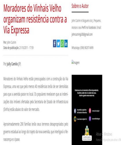
Figura 03: moradores do Vinhais Velho Organizam resistência contra a Via Expressa.

Destaco que no período em que se construía a Via Expressa, muitos movimentos foram realizados (figuras 03 e 04) para que o ato tivesse um novo projeto, onde não passasse pelo Vinhais Velho. Os agentes sociais juntamente com historiadores, políticos conhecedores da história de Uçaguaba – nome dado à aldeia de índios Tupinambás no local que hoje fica o Vinhais Velho – arqueólogos, se reuniram no intuito de manifestar suas opiniões e insatisfações pelo que estaria prestes a acontecer.