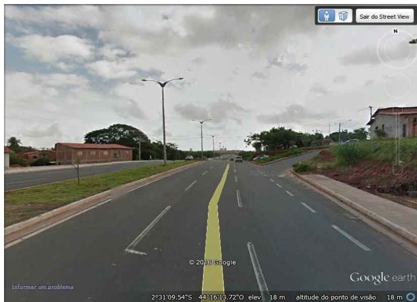
Figura 17: Via Expressa. À direita, entrada para a maior parte do Vinhais Velho.