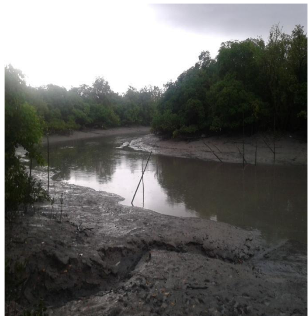
Figura 06: braço de mar no rio Anil.