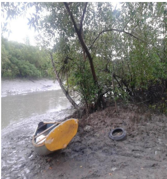
Figura 05: Área de manguezal no Vinhais Velho.

Essas práticas alimentícias eram o diferencial das comidas indígenas para as europeias. Os frutos do mar, até aos dias de hoje, são parte da vida dos povos que habitam a Comunidade Vinhais Velho, pela riqueza natural em manguezais (figuras 05 e 06) que ali existe, além do mais, a Comunidade é próxima ao rio Anil, o que fez com que muitos anos os moradores tirassem – e ainda tiram, porém de forma mais reduzida – sua subsistência, principalmente pela colheita de caranguejos e camarões.