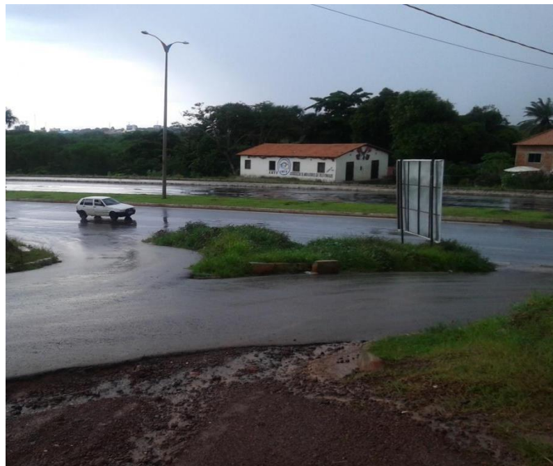
Figura 16: Área em que houve a retirada das casas para a passagem da Via Expressa.