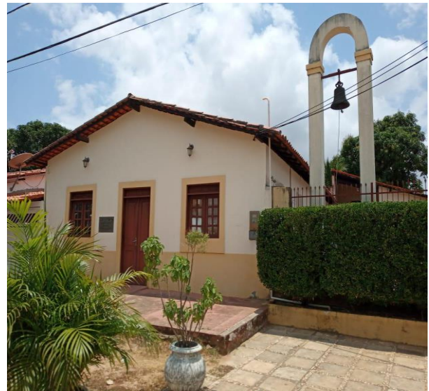
Figura 02: Memorial do Sítio Arqueológico do Vinhais Velho.

O memorial visto acima foi construído bem ao lado da Igreja de São João Batista, o que demonstra também uma interligação, tendo em vista que a Igreja de São João Batista também foi construída há muitos séculos (acredita-se que cerca de 400 anos atrás) e é considerada como Patrimônio Histórico Cultural e Imaterial da Humanidade.