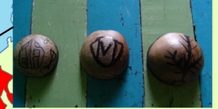
Fazendeiras de Cuias, Ilha Xingu