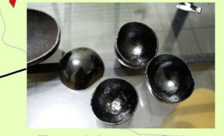
Fazendeiras de Cuias, Ilha Quianduba