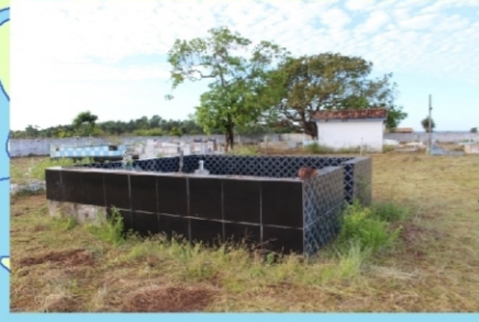
Cemitério de Comunidade Tradicional