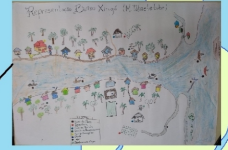
Santo Afonso Baixo Xingu