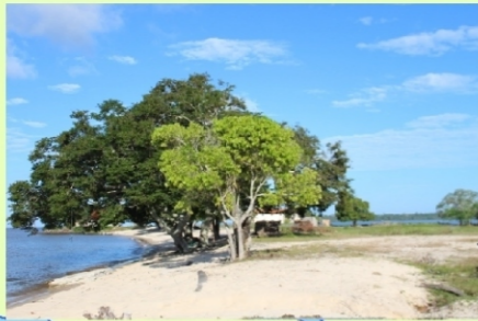
Enseada do Malato