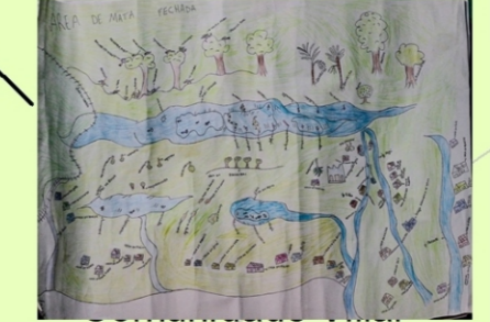
Comunidade Vilar Ilha Xingu