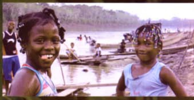
CONSEJO COMUNITARIO LOCAL NAPIPI, ENERO 2013.

está significando que es un desplazamiento que ha habido en el río; también observamos una botella, una bolsa, todo eso son las basuras que se arrojan a los ríos y está causándonos demasiada contaminación” (MAPA “CARTOGRAFÍA SOCIAL E IDENTIFICACIÓN DEL TERRITORIO DE COMUNIDADES DE CONSERVACIÓN DE FLORA Y FAUNA, ZONA 8 RÍO BOJAYÁ, CHOCÓ, COCOMACIA”, ELABORADO COLECTIVAMENTE Y PRESENTADO POR ESAÚ MENA).