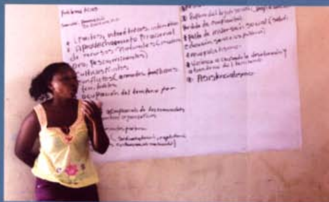
IDENTIFICANDO Y MAPEANDO AMENAZAS, CONFLICTOS, RECURSOS Y FORTALEZAS EN LOS TERRITORIOS COLECTIVOS. ENCUENTRO REALIZADO EN NAPIPI, 29 DE ENERO DE 2013.

“El territorio es un lugar muy especial para la vida, es lo primero para el ser humano sobrevivir, en el aire nadie se sostiene, entonces es la base fundamental para las comunidades. A todo el mundo le interesa el territorio, porque sin territorio nadie vive. Es un territorio que ya lo conocemos, ya existe un arraigamiento, por eso cuando se presentan los desplazamientos la gente se