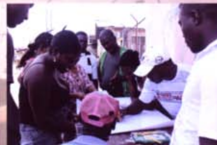
MAPEAMIENTO PARTICIPATIVO EN EL RÍO ATRATO, ENCUENTRO 30 DE ENERO 2013.

nemos [...] Tenemos unos puntos cafés son unas zonas que ya fueron explotadas, o sea, zonas de recuperación y los puntos verdes son zonas que se pueden aprovechar, que todavía están en explotación [...] Tenemos unas debilidades y es que aquí se trabaja pero hay mucha plaga, enfermedades para los cultivos [...] Otro problema es que la cultura está como desapareciendo, en la parte cultural teníamos cuenta chistes y adivinanzas, la gente se integraba en los pueblos a través del deporte y la fiesta, eso ya no se ve [...] El tema con los indios, por Arrastradero sería el límite y a ellos les gusta bajarse y cuando se dieron cuenta que este terreno es bueno empezó la discusión y empezaron a decir que ellos habían hecho ampliación y esto hay que tratar de solucionarlo [...] Otra cosa que indirectamente nos afectaría es la cuestión de la explotación minera en el Cerro Careperro, al explotar estos sectores arrojarían sedimentos y como hay ciénagas podrían desaparecer, entonces esa sería una amenaza por las grandes industrias [...] una fortaleza es la organización COCOMACIA y el decreto 1745 del 95 que es lo que nos da la titulación colectiva, un reconocimiento como comunidades negras a tener derecho a estas propiedades” (MAPA COMUNIDADES DEL BRAZO DE MURINDÓ - ANTIOQUIA, ZONA 9 ÁREA INFLUENCIA DE LA COCOMACIA, ELABORADO COLECTIVAMENTE Y PRESENTADO POR HAMILTON RDA).