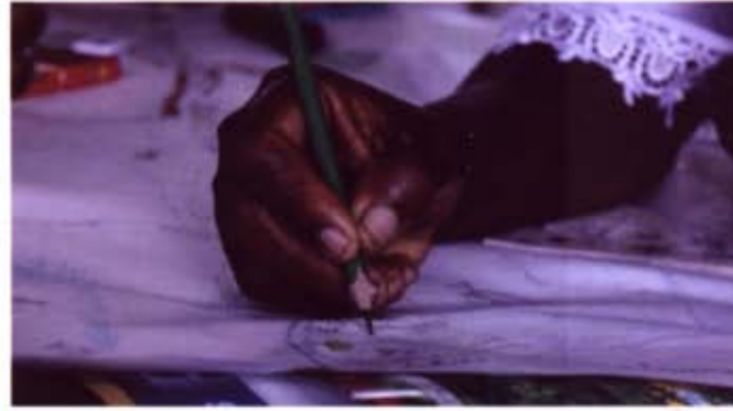
CONSEJO COMUNITARIO LOCAL NAPIPI, ENERO 2013.

“En el Atrato esta es la parte de San Alejandro, baja por aquí y tenemos aquí Alana, tenemos a Urama, la Quebrada Eva y la Quebrada Primitivo [...] en el Atrato tenemos un problemita que es el tema de la inundación, la tierra es muy fértil pero productos perennes no podemos meter porque el río se nos monta y acaba con lo que te-