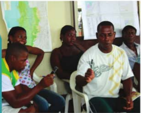
DISCUSIÓN SOBRE TIPOS DE CONFLICTOS, FORTALEZAS, SABERES Y FORMAS DE RESISTENCIA EN TERRITORIOS DE LOS CONSEJOS COMUNITARIOS LOCALES, MEDIO ATRATO.

* Datos Centro de Estudios para la Justicia Social Tierra Digna. En: http://www.pacifico.com.co/documentos