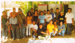
Foto ao lado: Participantes da Oficina de Cartografia em 22/06/2007