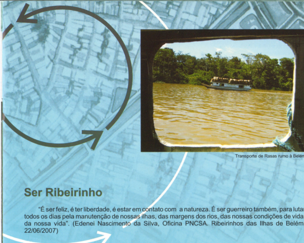
Transporte de Rasas rumo à Belém

Em dezembro de 2005, em reunião do Conselho da Cidade e lideranças dos movimentos sociais em Belém, foi apresentado o projeto "Nova Cartografia Social da Amazônia" e o resultado dos trabalhos de pesquisa com moradores de coco babaçu e quilombolas. Das situações sociais identificadas resultou a mobilização dos presentes na reunião para o desenvolvimento do Projeto com grupos que vivem nas cidades. A partir desta reunião teve origem a Série "Movimentos Sociais e Conflitos nas Cidades da Amazônia". Esta série inclui com os indígenas, homossexuais, afro-religiosos e negras e negros de Belém, e tem continuidade com outros grupos em Belém e outras cidades da Amazônia como Manaus(AM), Macapá(AP), Marabá, Salinópolis e Santarém(PA).